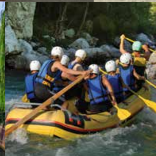
Soča Tal – Fluss Soča