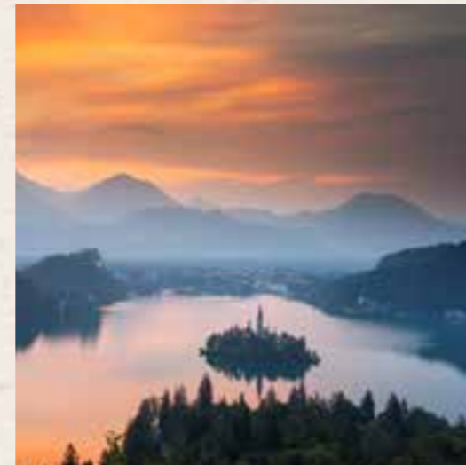
Bled – Bleder See