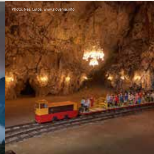
Postojna – Grotten von Postojna