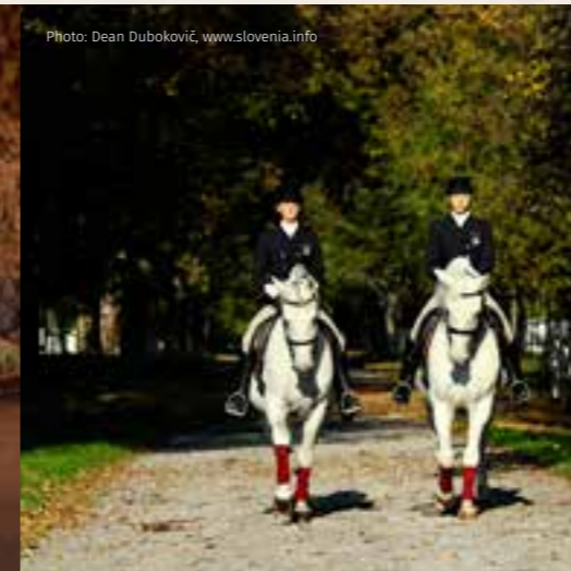
Lipica – Gestüt Lipica