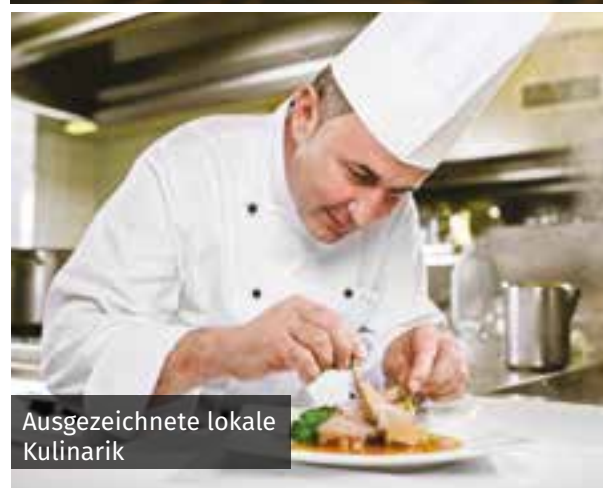
Ausgezeichnete lokale Kulinarik