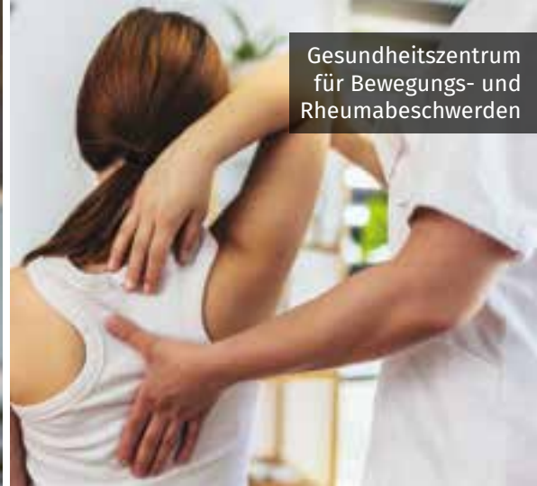
Gesundheitszentrum für Bewegungs- und Rheumabeschwerden