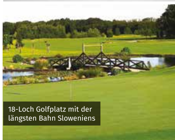
18-Loch Golfplatz mit der längsten Bahn Sloweniens