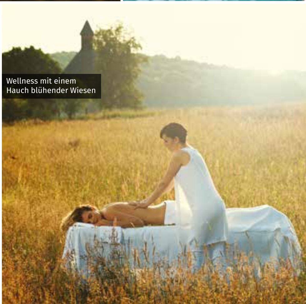
Wellness mit einem Hauch blühender Wiesen