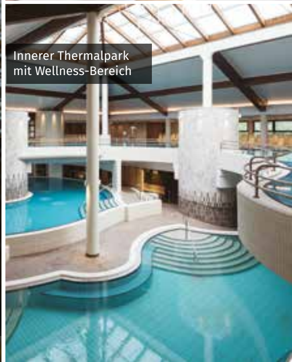
Innerer Thermalpark mit Wellness-Bereich