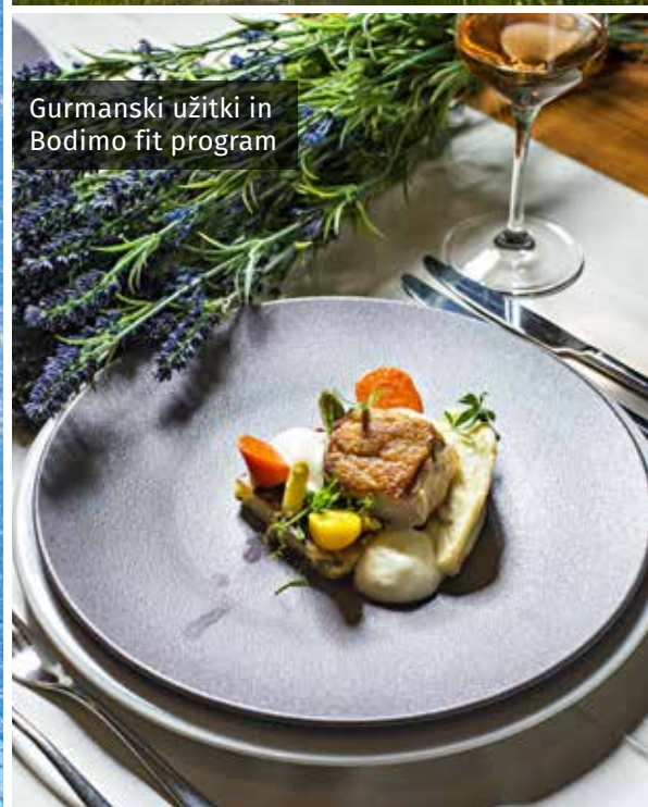
Gurmanski užitki in Bodimo fit program