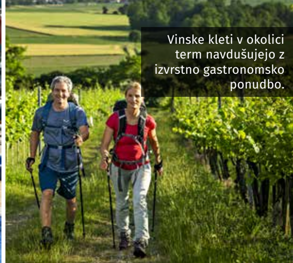
Vinske kleti v okolici term navdušujejo z izvrstno gastronomsko ponudbo.