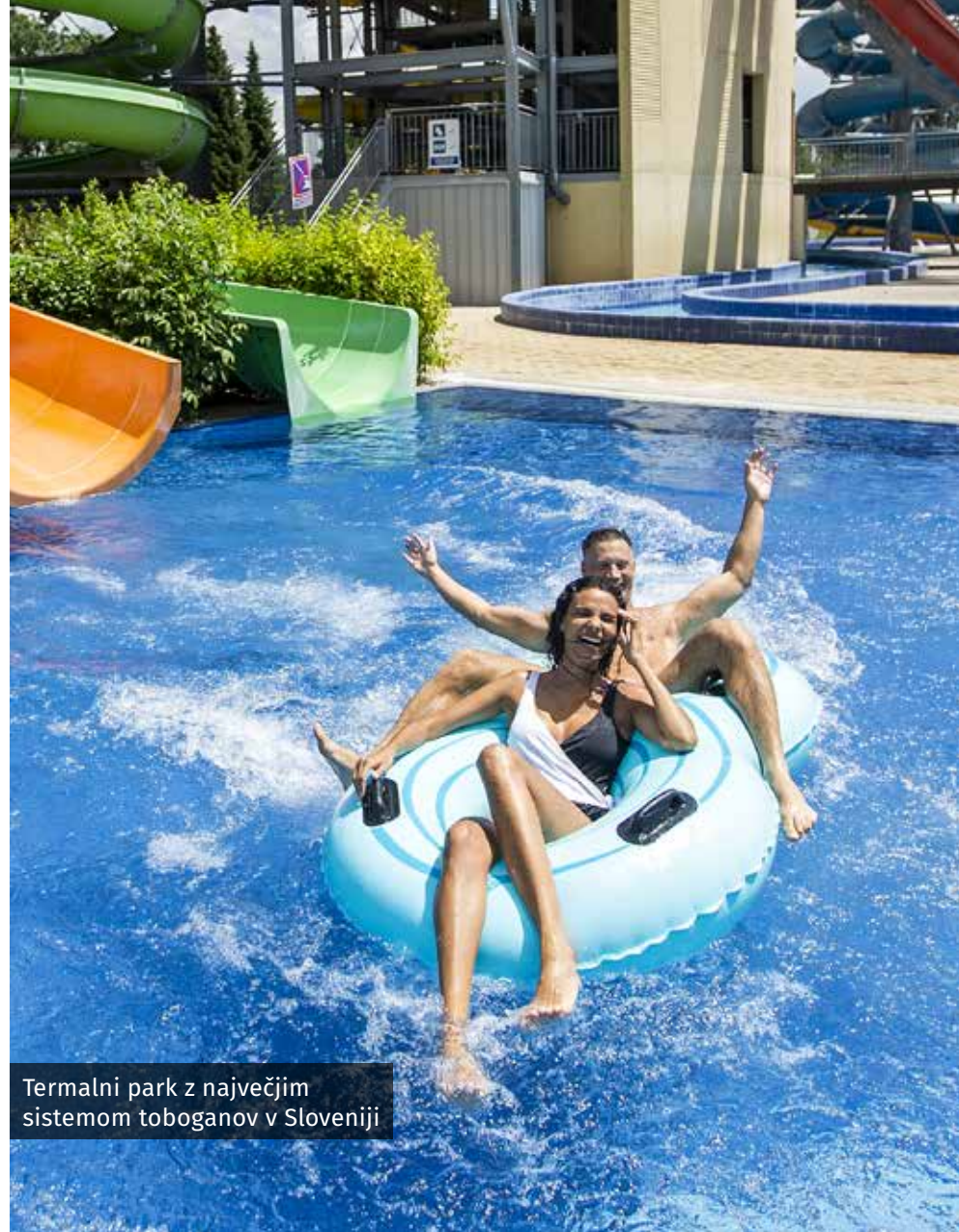
Termalni park z največjim sistemom toboganov v Sloveniji