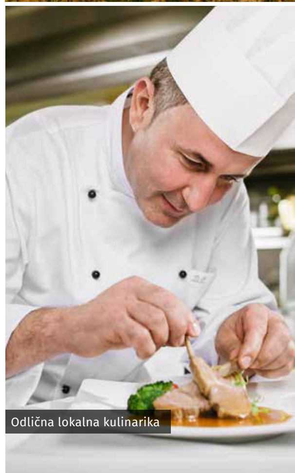
Odlična lokalna kuhinarika