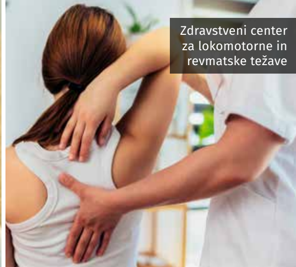
Zdravstveni center za lokomotorne in revmatske težave