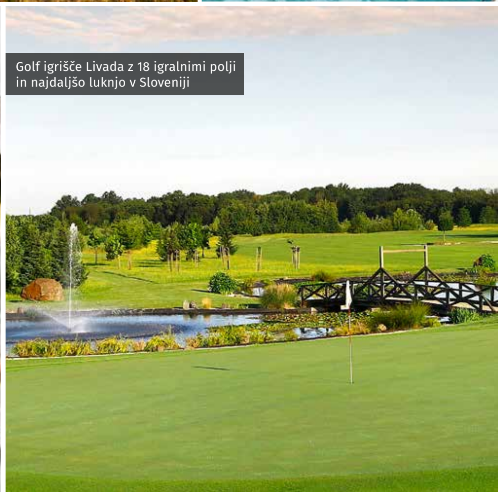
Golf igrišče Livada z 18 igralnimi polji in najdaljšo luknjo v Sloveniji