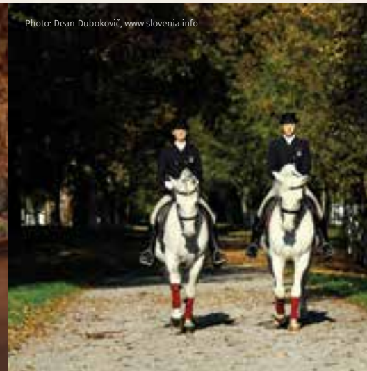
Lipica - Kobilarna Lipica