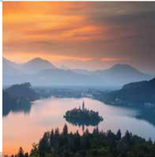
Bled - Blejsko jezero