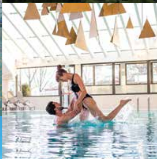
Blagodejna termalna voda