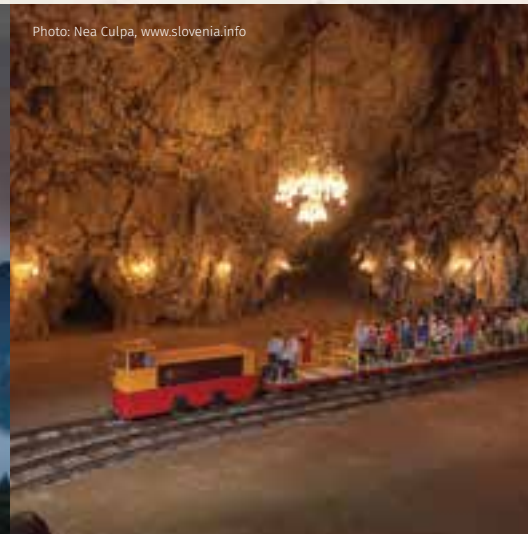
Postojna - Postojnska jama