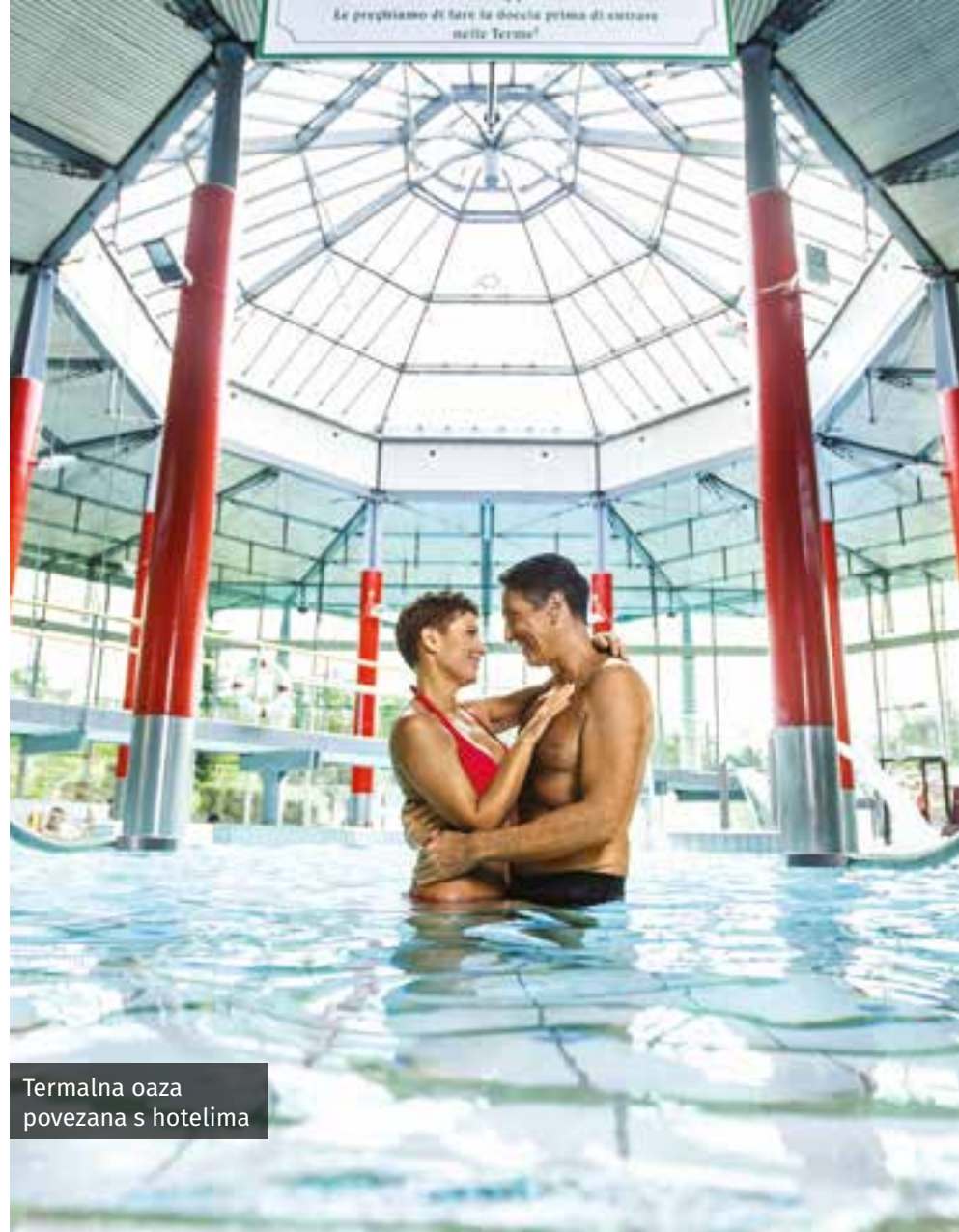
Termalna oaza povezana s hotelima