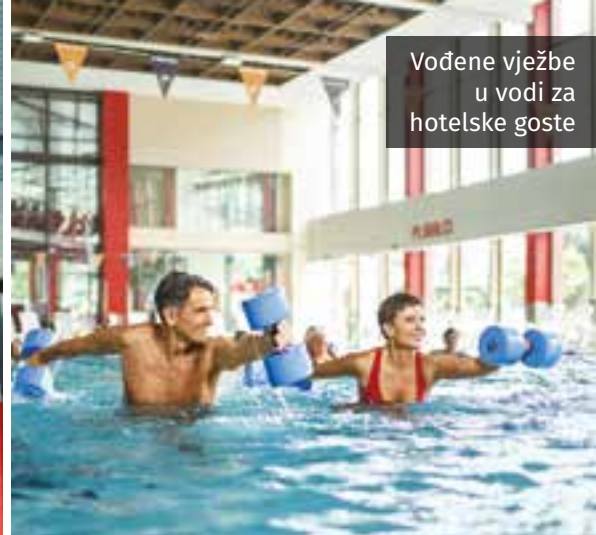
Vođene vježbe u vodi za hotelske goste