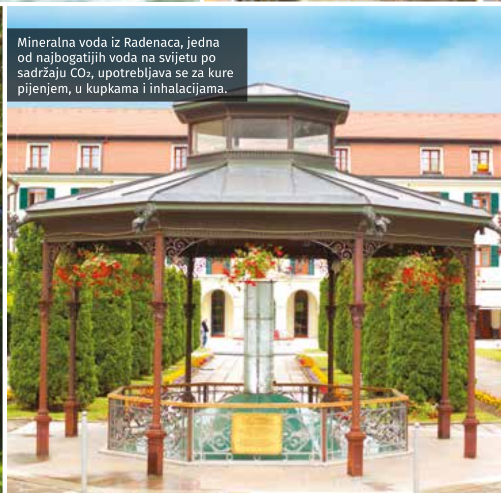
Mineralna voda iz Radenaca, jedna od najbogatijih voda na svijetu po sadržaju CO 2 , upotrebljava se za kure pijenjem, u kupkama i inhalacijama.