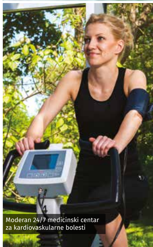
Moderan 24/7 medicinski centar za kardiovaskularne bolesti