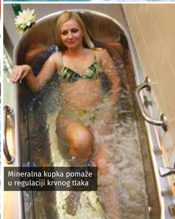
Mineralna kupka pomaže u regulaciji krvnog tlaka