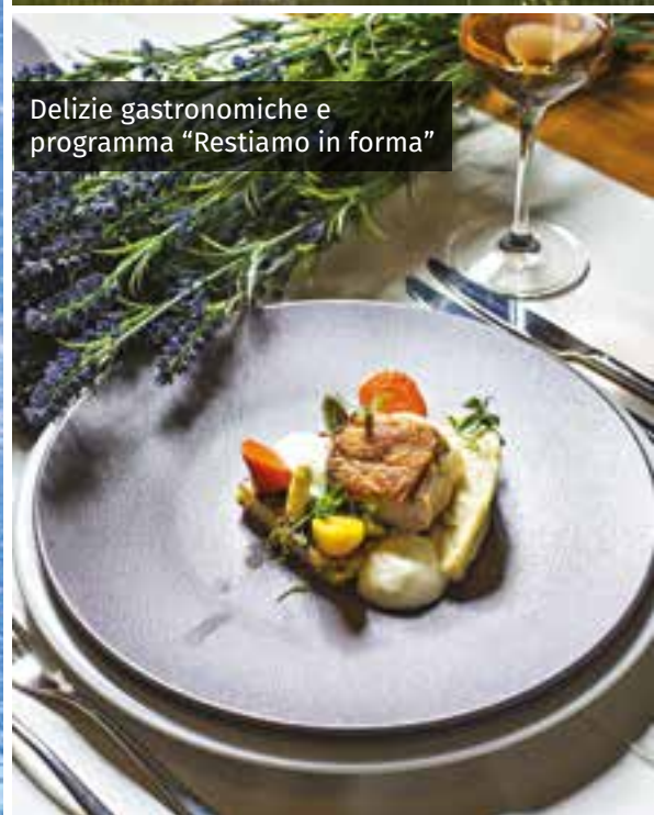
Delizie gastronomiche e programma "Restiamo in forma"