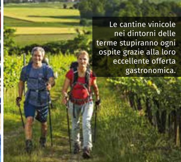
Le cantine vinicole nei dintorni delle terme stupiranno ogni ospite grazie alla loro eccellente offerta gastronomica.