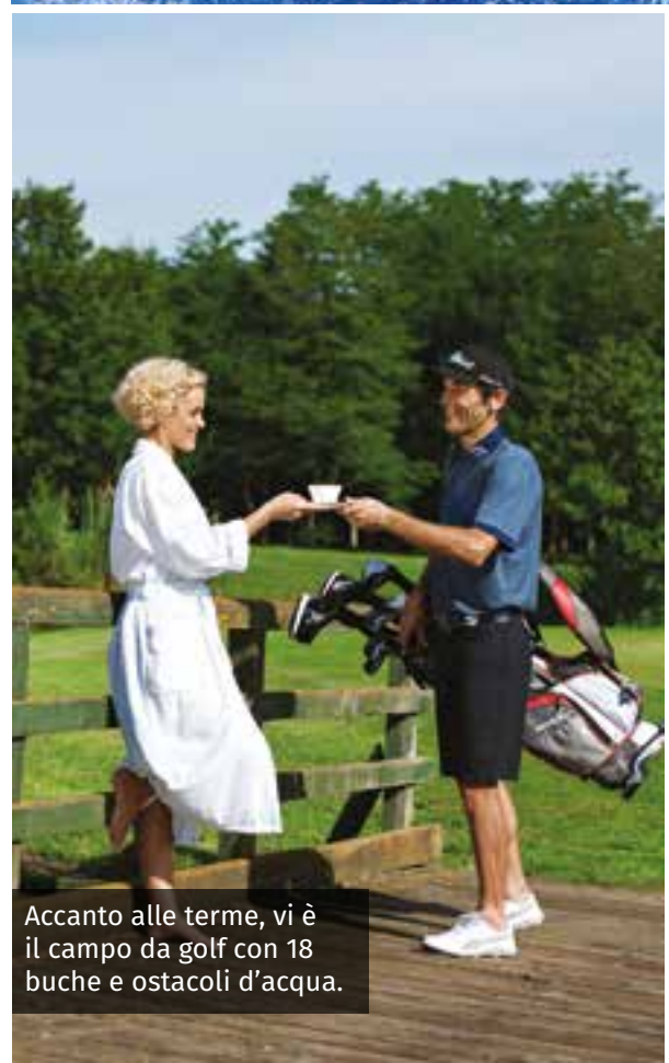
Accanto alle terme, vi è il campo da golf con 18 buche e ostacoli d'acqua.