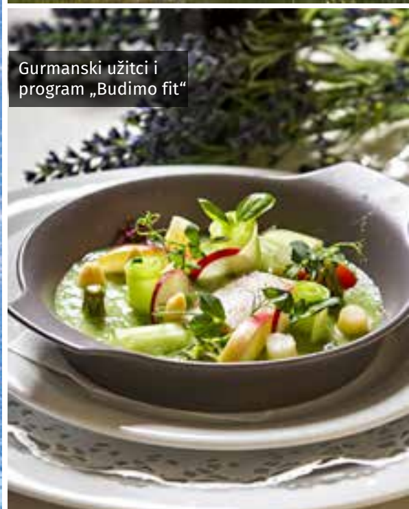
Gurmanski užitci i program „Budimo fit“