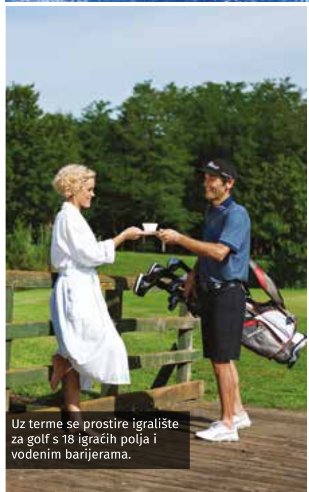
Uz terme se prostire igralište za golf s 18 igračih polja i vodenim barijerama.