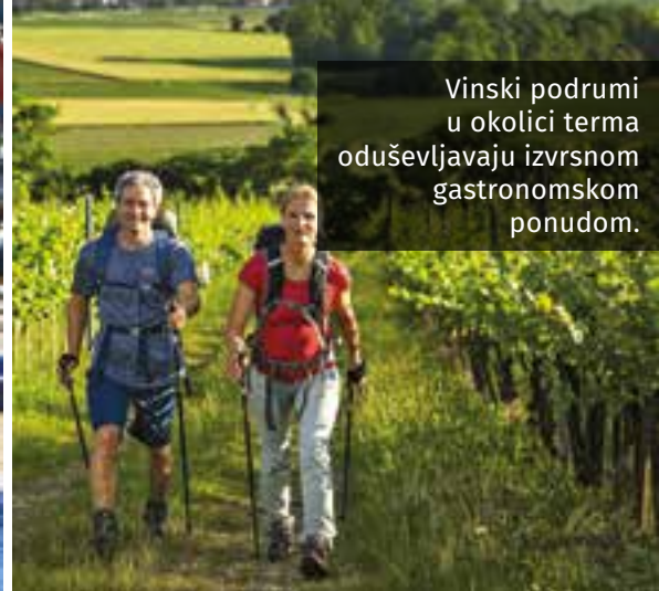
Vinski podrumi u okolici terma oduševljavaju izvrsnom gastronomskom ponudom.