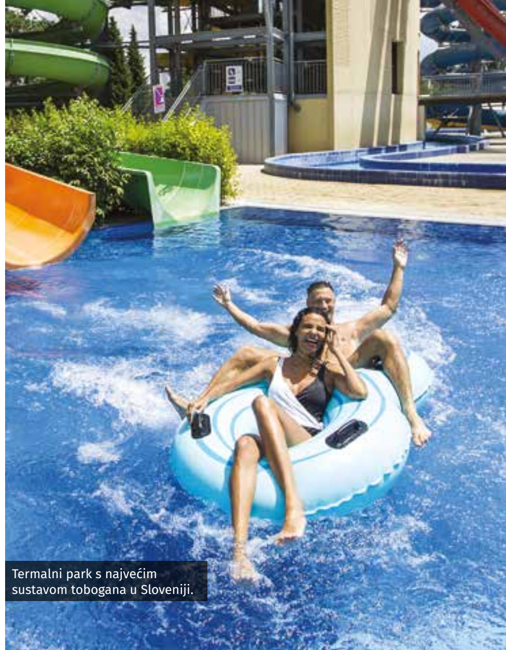
Termalni park s najvećim sustavom tobogana u Sloveniji.