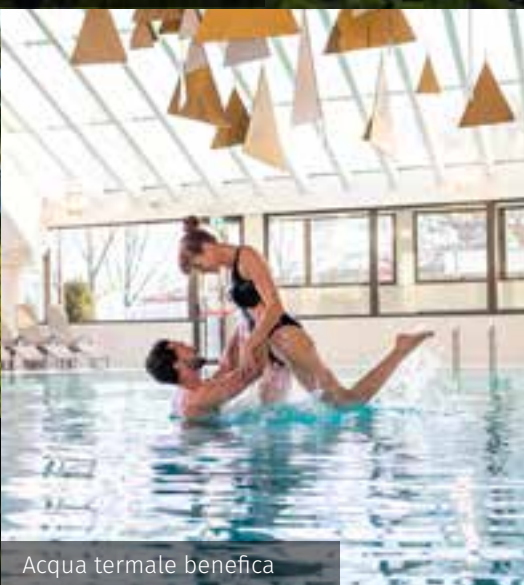
Acqua termale benefica