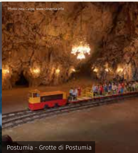
Postumia - Grotte di Postumia