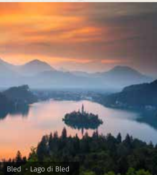
Bled - Lago di Bled

Venezia, Marco Polo 190 km (I) Klagenfurt 196 km (A)