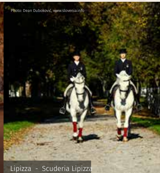
Lipizza - Scuderia Lipizza