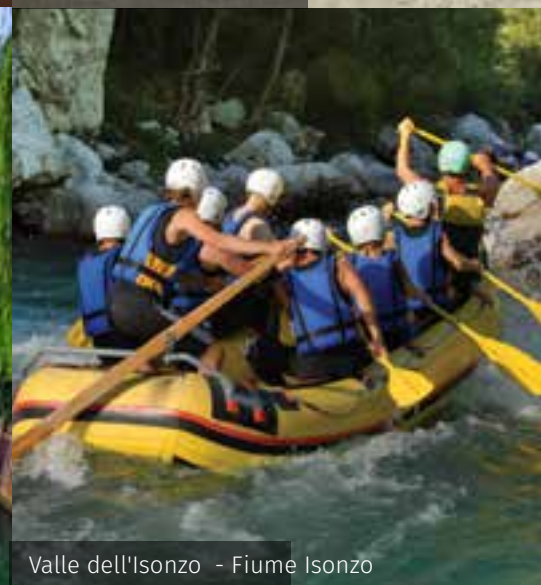
Valle dell'Isonzo - Fiume Isonzo