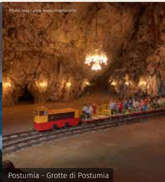
Postumia - Grotte di Postumia