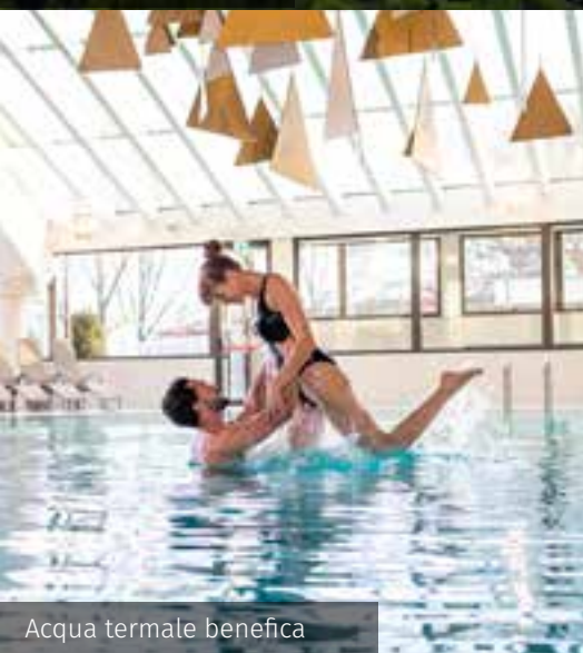
Acqua termale benefica