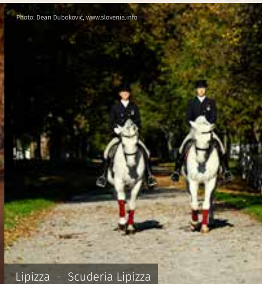
Lipizza - Scuderia Lipizza