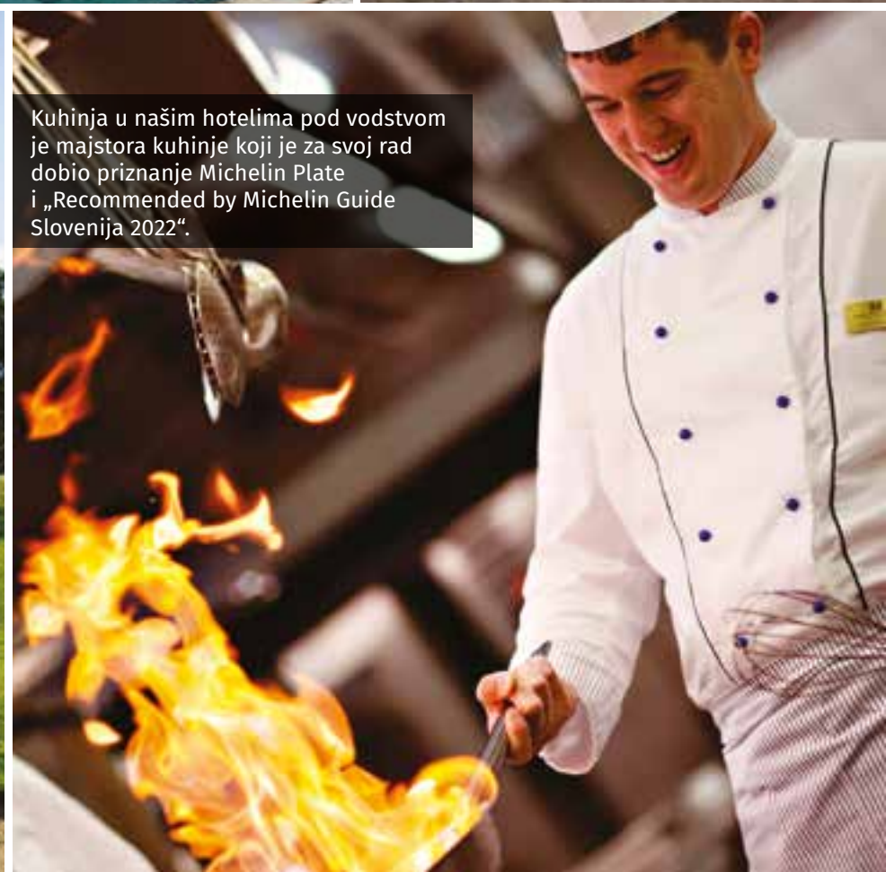
Kuhinja u našim hotelima pod vodstvom je majstora kuhinje koji je za svoj rad dobio priznanje Michelin Plate i „Recommended by Michelin Guide Slovenija 2022“.