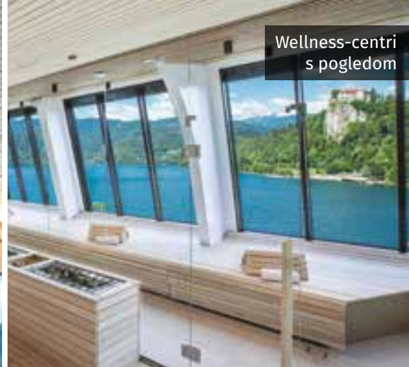
Wellness-centri s pogledom