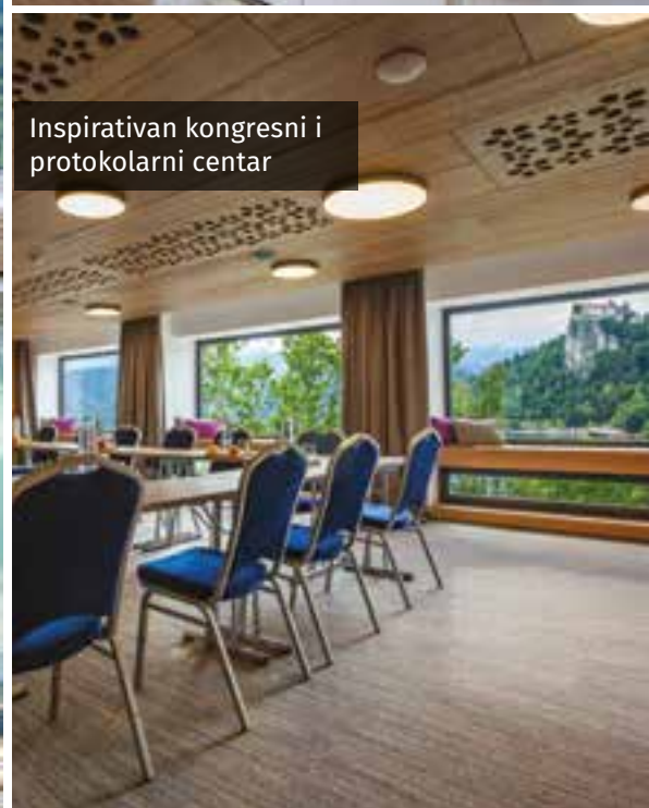
Inspirativan kongresni i protokolarni centar