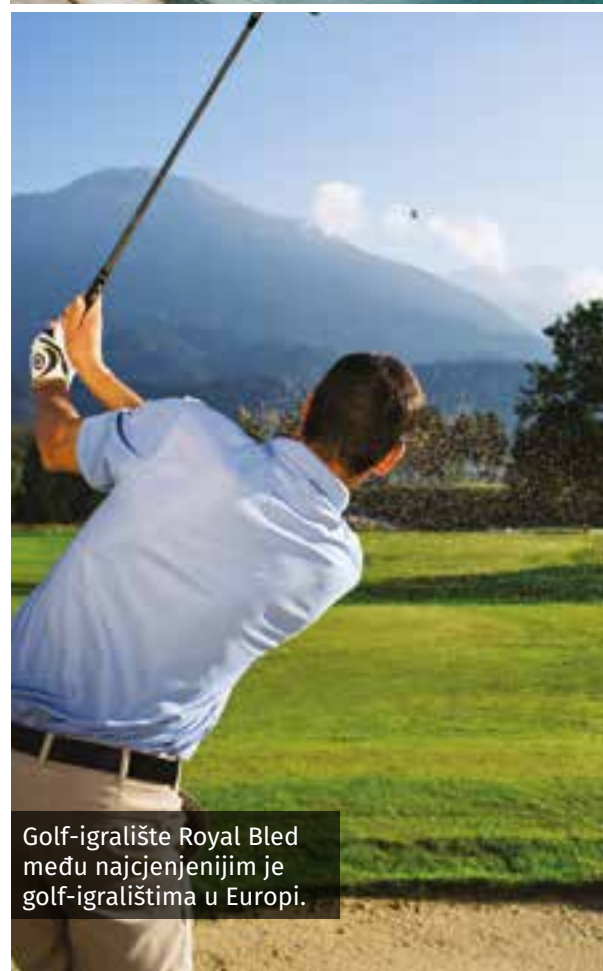
Golf-igralište Royal Bled među najcjenjenijim je golf-igralištima u Evropi.