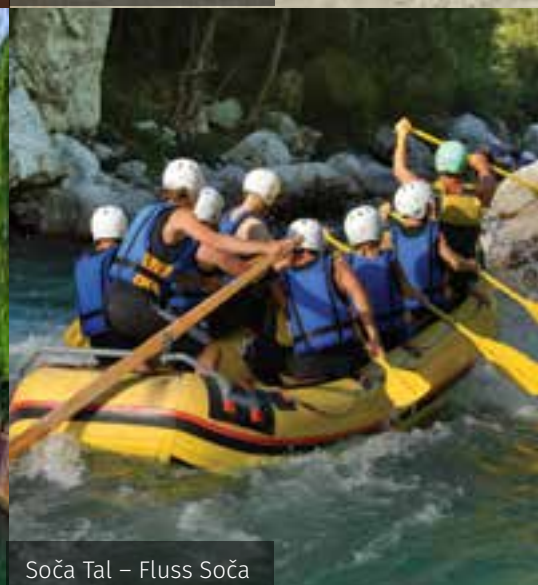
Soča Tal – Fluss Soča