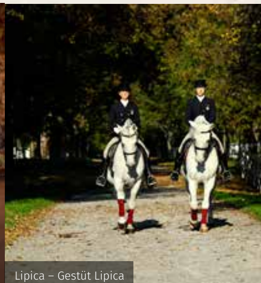
Lipica – Gestüt Lipica