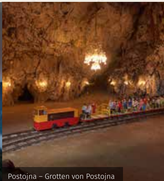
Postojna – Grotten von Postojna