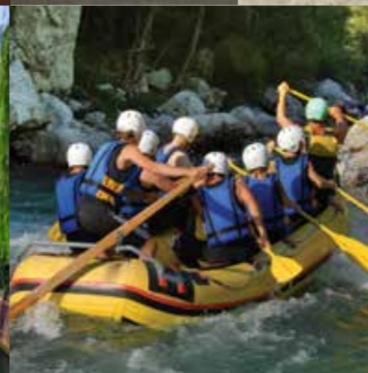
Soška dolina - reka Soča