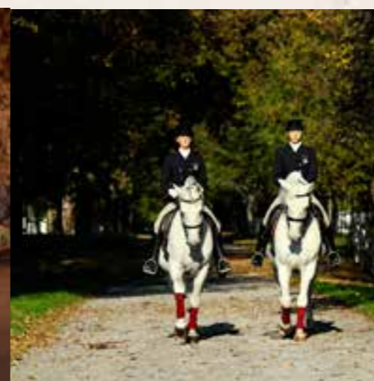
Lipica - Kobilarna Lipica