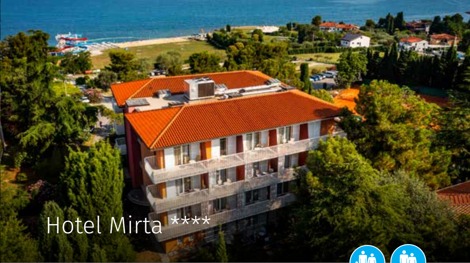
Hotel Mirta ****