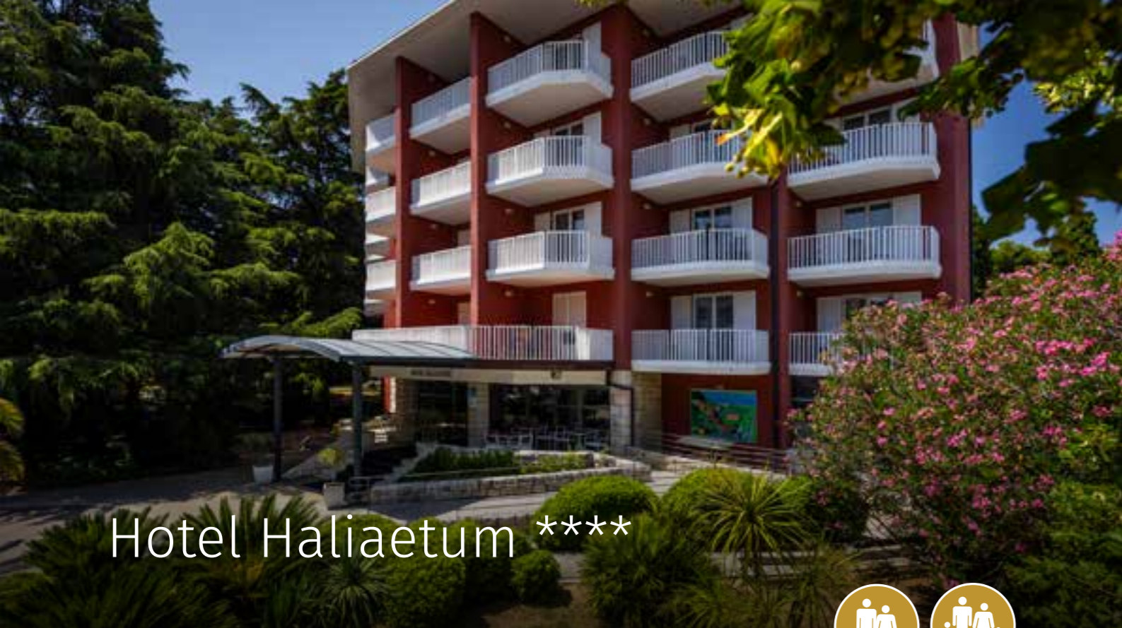
Hotel Haliaetum ****