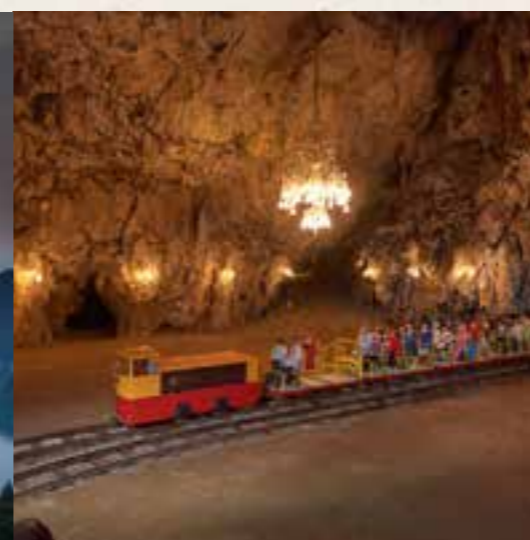
Postojna - Postonjska jama