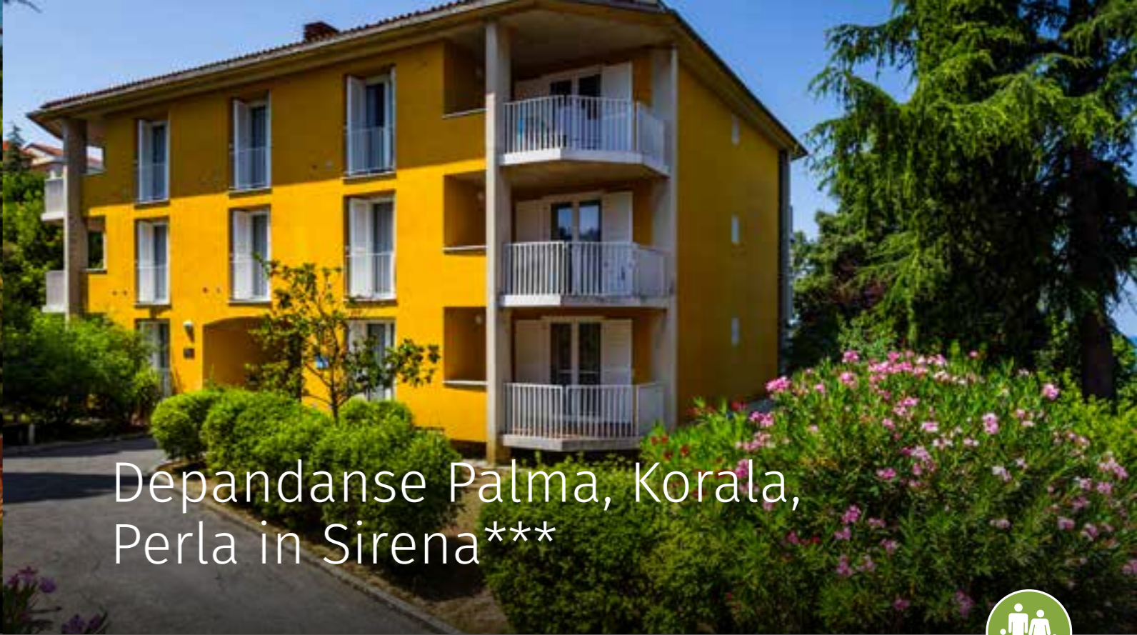
Depandanse Palma, Korala, Perla in Sirena ***