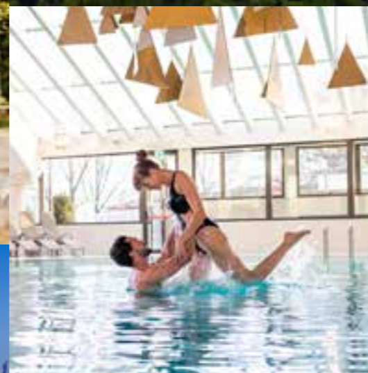
Blagodejna termalna voda