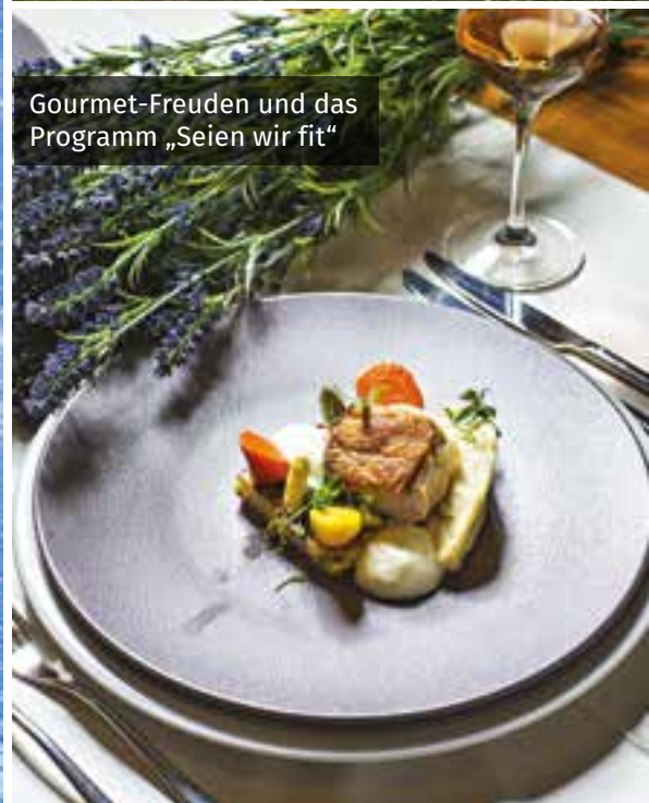
Gourmet-Freuden und das Programm „Seien wir fit“