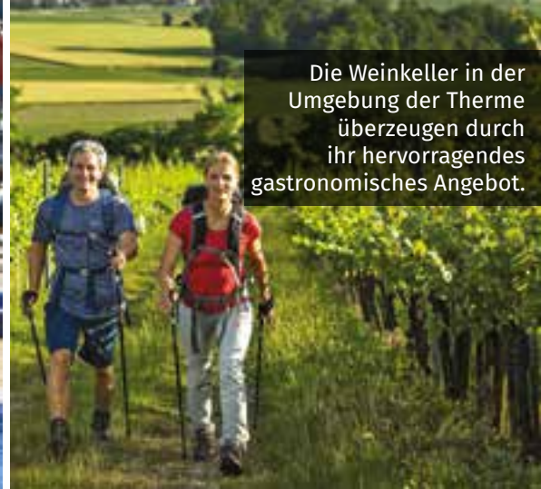
Die Weinkeller in der Umgebung der Therme überzeugen durch ihr hervorragendes gastronomisches Angebot.