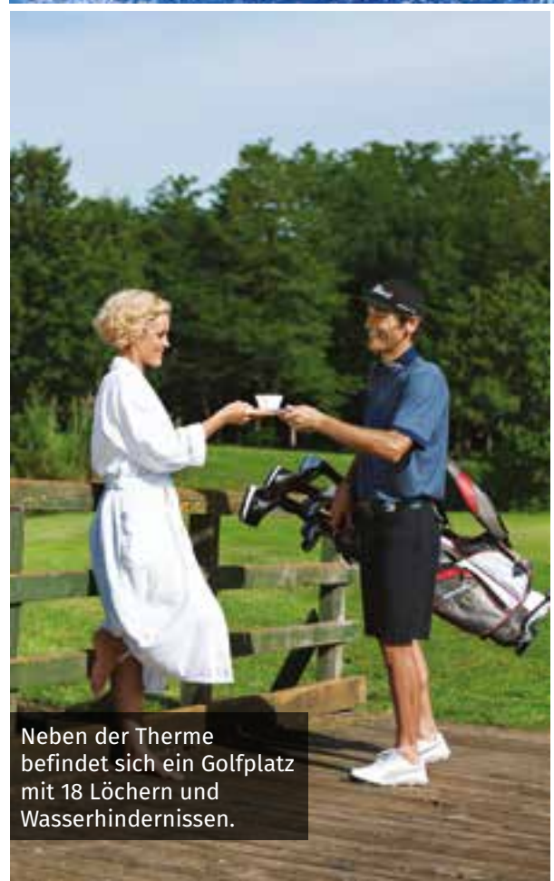
Neben der Therme befindet sich ein Golfplatz mit 18 Löchern und Wasserhindernissen.