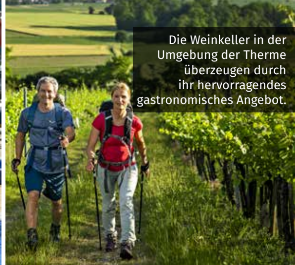
Die Weinkeller in der Umgebung der Therme überzeugen durch ihr hervorragendes gastronomisches Angebot.