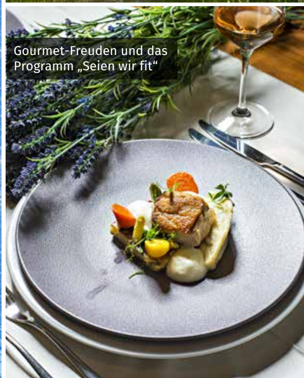
Gourmet-Freuden und das Programm „Seien wir fit“