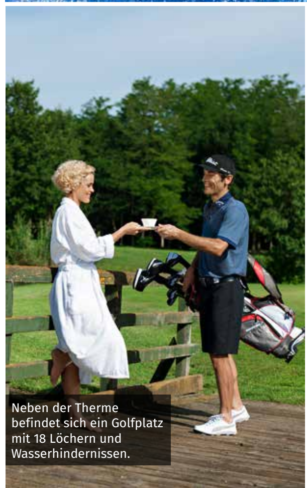
Neben der Therme befindet sich ein Golfplatz mit 18 Löchern und Wasserhindernissen.