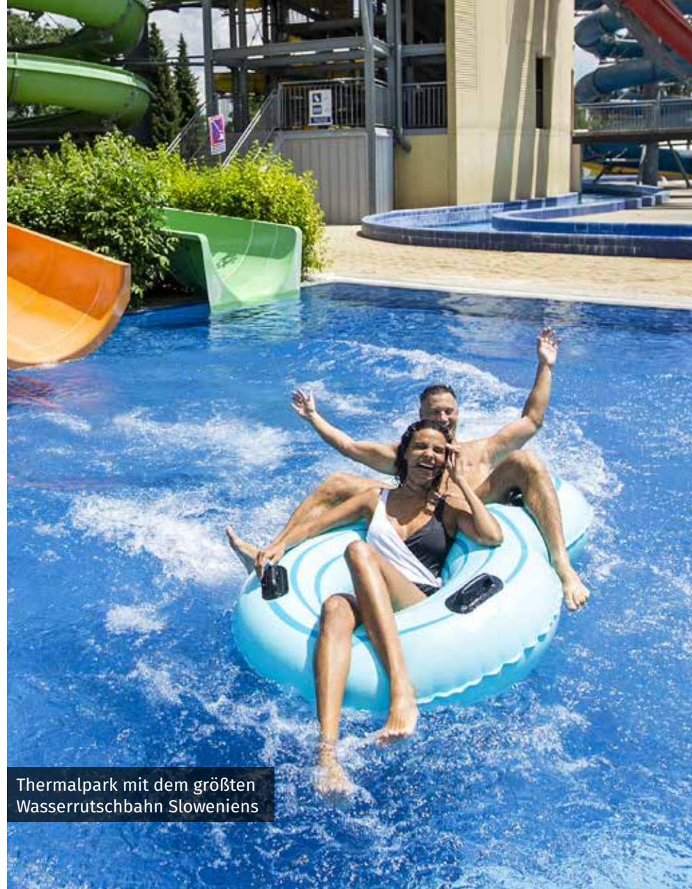
Thermalpark mit dem größten Wasserrutschbahn Sloweniens