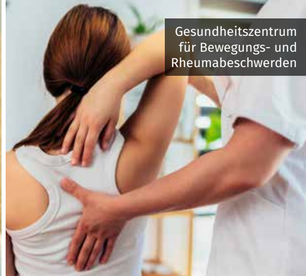
Gesundheitszentrum für Bewegungs- und Rheumabeschwerden