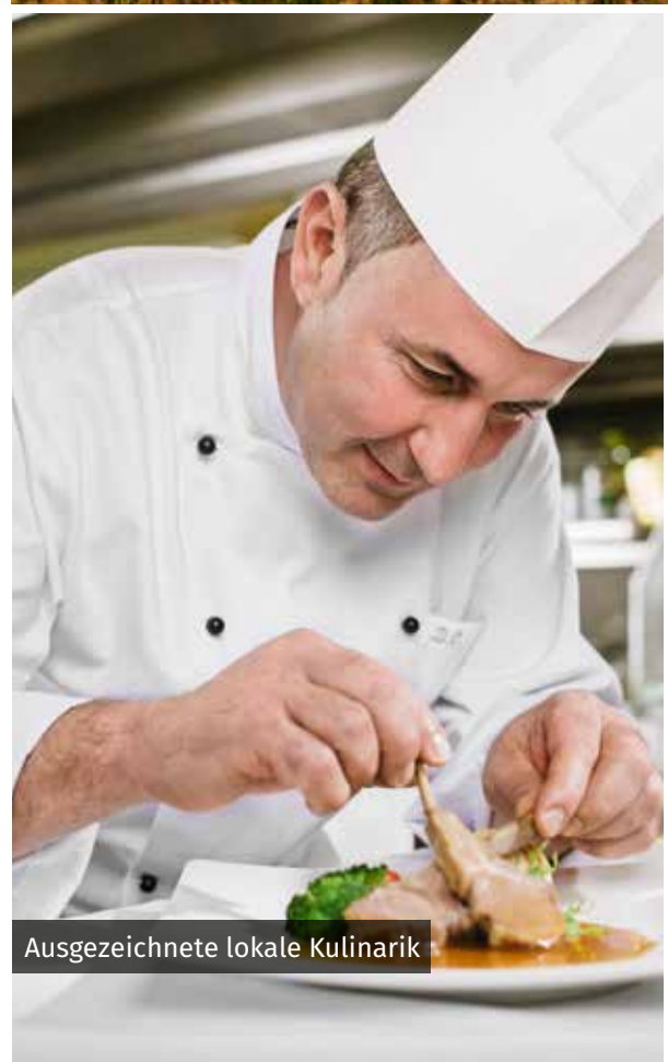
Ausgezeichnete lokale Kulinarik