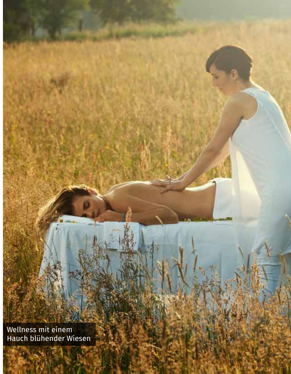
Wellness mit einem Hauch blühender Wiesen