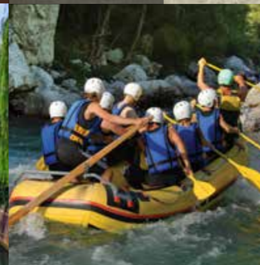
Valle dell'Isonzo - Fiume Isonzo