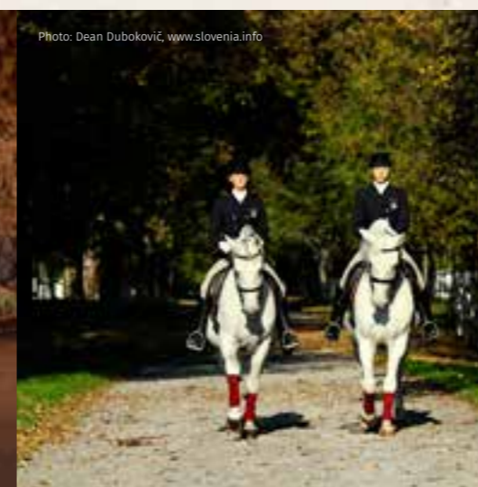
Lipizza - Scuderia Lipizza