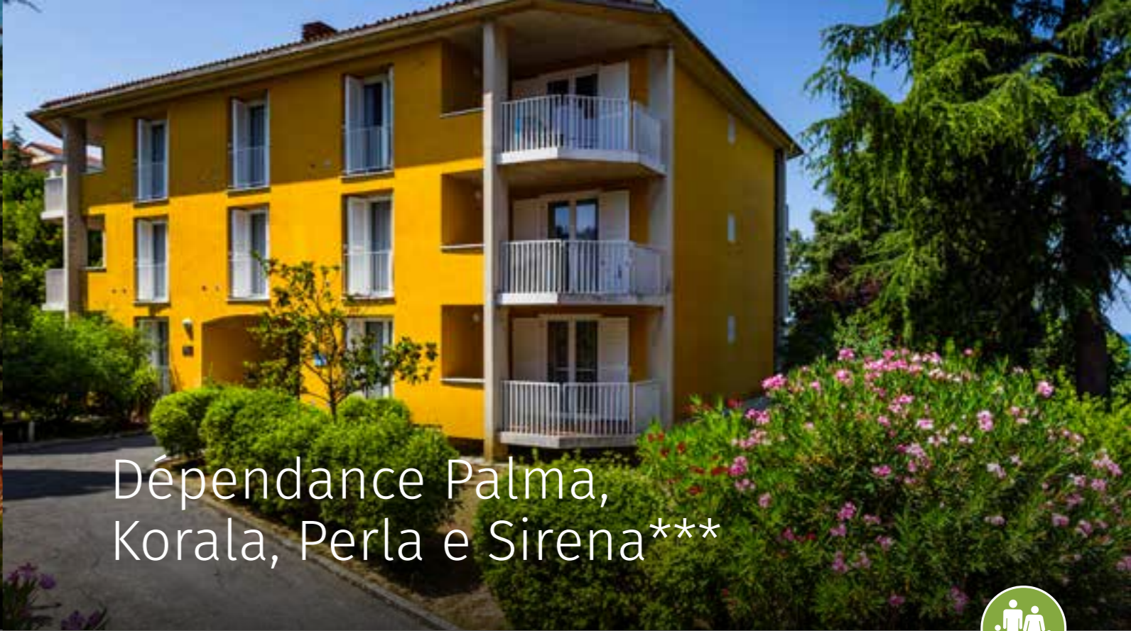
Dépendance Palma, Korala, Perla e Sirena ***