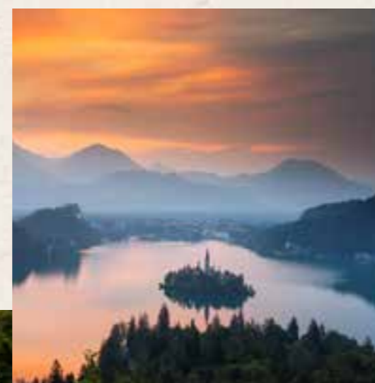
Bled - Lago di Bled

Venezia, Marco Polo 190 km (I) Klagenfurt 196 km (A)