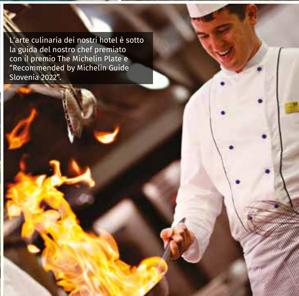
L'arte culinaria dei nostri hotel è sotto la guida del nostro chef premiato con il premio The Michelin Plate e "Recommended by Michelin Guide Slovenia 2022".