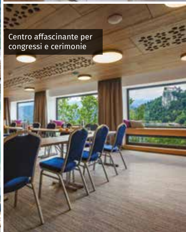
Centro affascinante per congressi e cerimonie