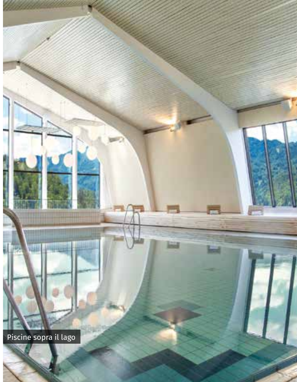
Piscine sopra il lago