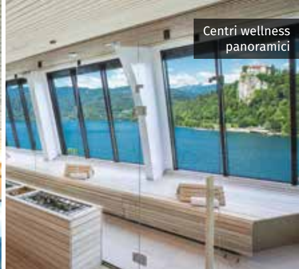
Centri wellness panoramici